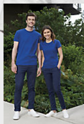
SOL'S IMPERIAL WOMEN 11502