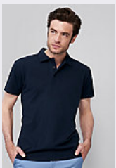
SOL'S SUMMER II 11342