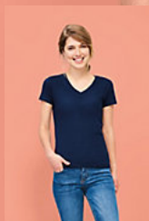
SOL'S IMPERIAL V WOMEN 02941